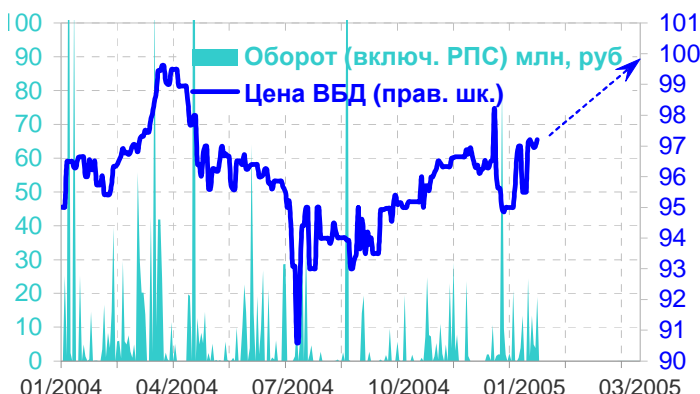
Цена ВБД-01, % и объемы торгов, млн. руб.